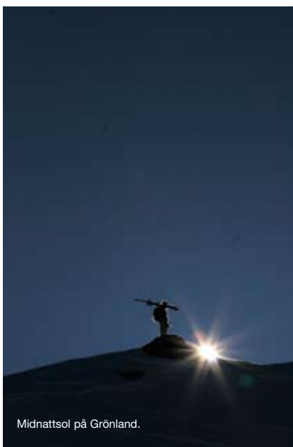
Midnattsol på Grönland.