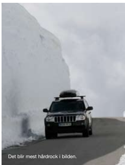
Det blir mest hårdrock i bilden.