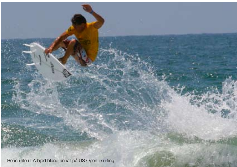
Beach life i LA bjöd bland annat på US Open i surfing.