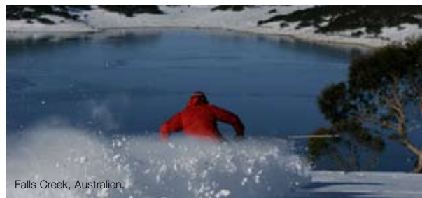
Falls Creek, Australien.