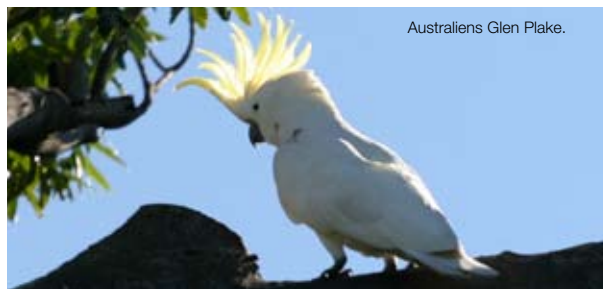
Australiens Glen Plake.